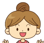
おかあさん 雑誌担当