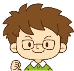
おとうさん 新聞担当